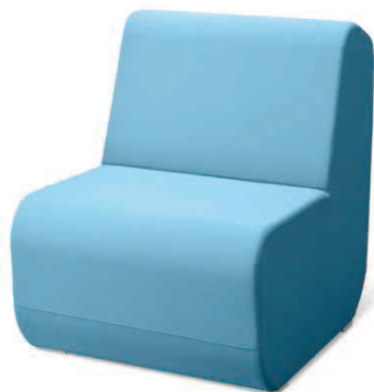
OPENPORT K ■