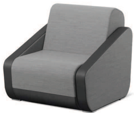
OPENPORT K/BR ■