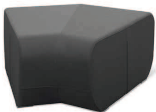
OPENPORT D-45° ■