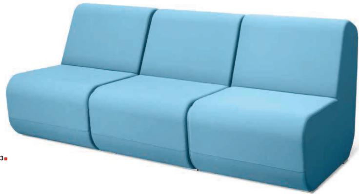
OPENPORT K3 ■