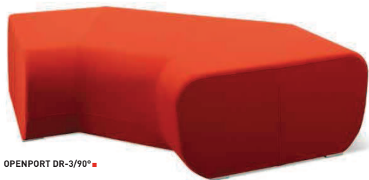
OPENPORT DR-3/90° ■