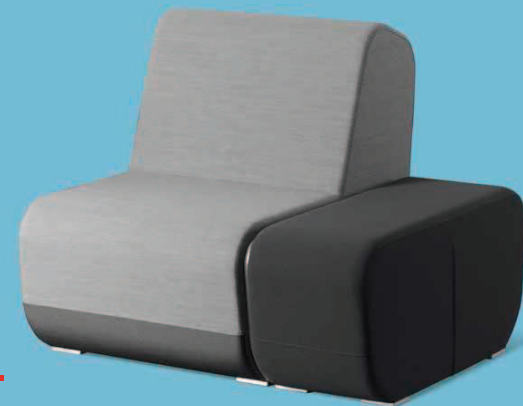
OPENPORT KL+KTR ■