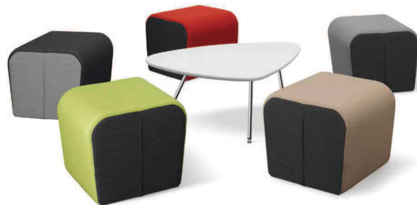
OPENPORT T ■