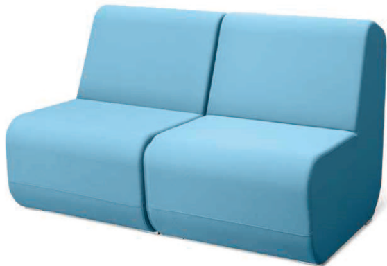
OPENPORT K2 ■