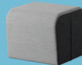
OPENPORT T ■