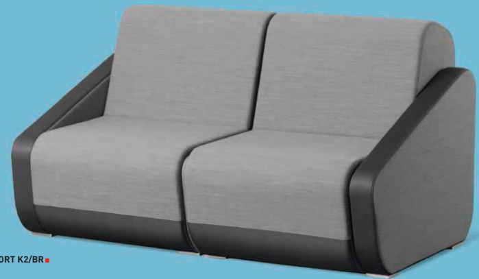
OPENPORT K2/BR ■